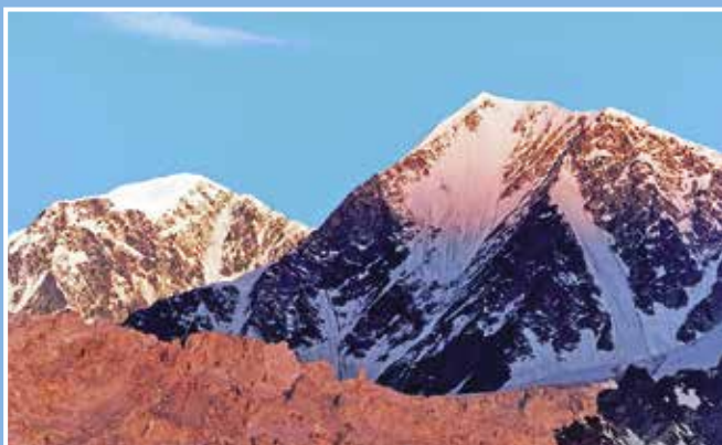
Красный лёд. Утро на леднике Менсу, Алтай