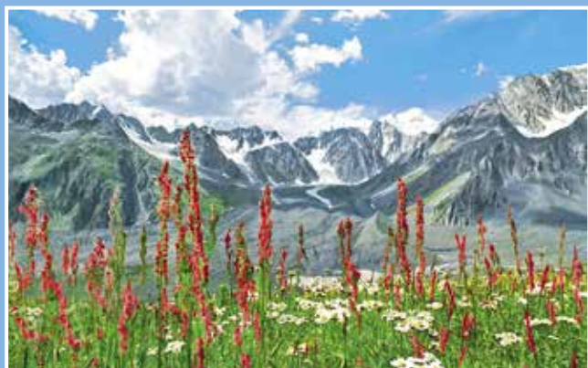
Альпийский луг перед Белухой. Алтай