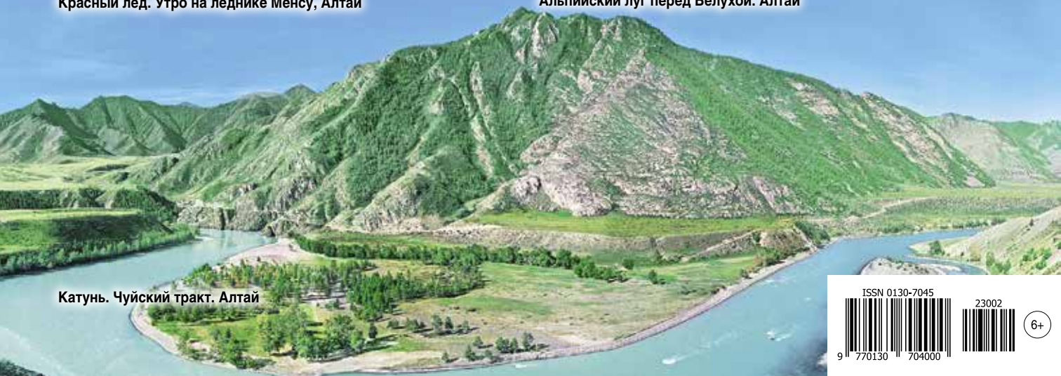
Катунь. Чуйский тракт. Алтай