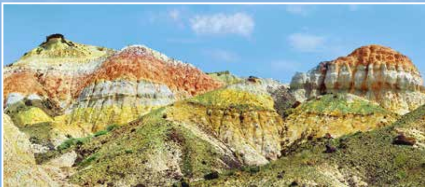
Цветные глины. Восточный Казахстан

Читайте в номере о роли этого удивительного места в формировании человеческой цивилизации.